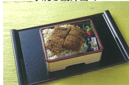
手焼き鰻弁当ミニ